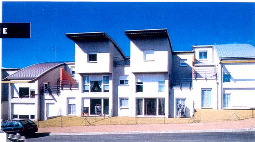
La zac de Beauregard à Coulanges, dans la Nièvre, comprend 34 logements PLA en R+1.